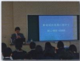
地域理解講座 5領域の地元専門家

「海と産業」「海と人間」「海の文化」「三陸の自然」「海と防災」の5領域に分かれグループ研究。多様な地域課題を理解させ、批判的・科学的思考力、プレゼンテーションする力を中心とするコミュニケーション力を育成する。