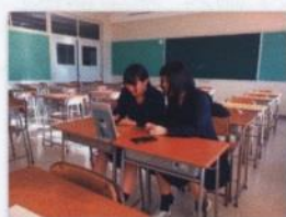
スカイプによるアメリカの 大学生との交流

国内の発表会・研修会12回100名・震災交流12回250名・気仙沼市との連携5回17名・近隣小学校へプログラミング講習会10名 他