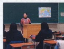
異文化理解講座 CSセミナー全5回