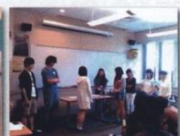
Express Yourself!2016 短期留学（春・夏）