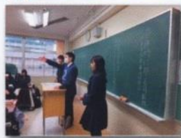
生徒による防災学習