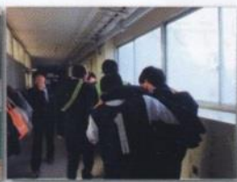
負傷者を想定しての防災訓練