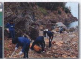
海岸清掃ボランティア