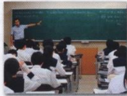
テクニカル講座 レポート文章講座 IT活用講座 図書情報講座