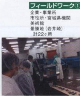
フィールドワーク① 企業・事業所 市役所・宮城県機関 美術館 景勝地（岩井崎） 計22ヶ所